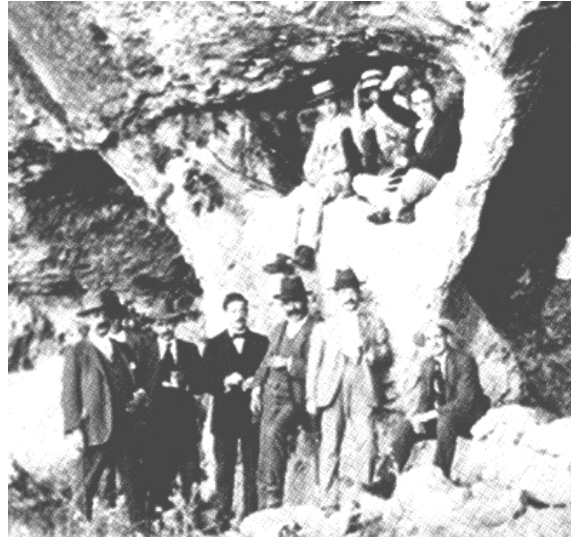
1915. Visita de los Correspondientes R. A. Historia